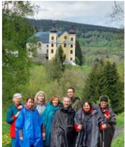
Neratov. Část poutníků z Čestlic

Dáša Šubrtová, Římskokatolická farnost Čestlice