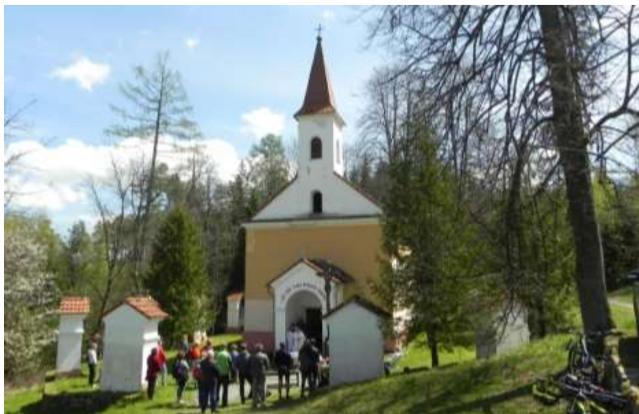
Dobrá Voda u Milejovic