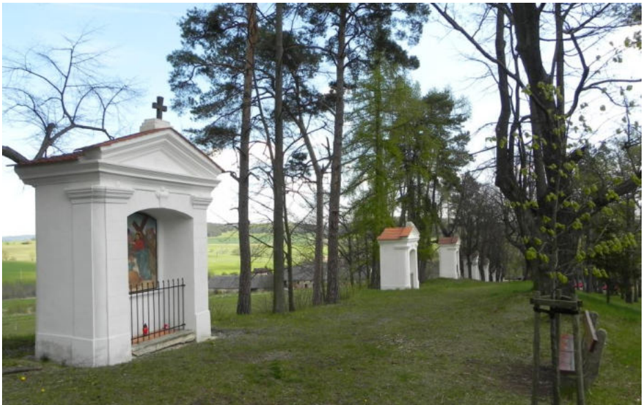
Křížová cesta Vlachovo Březí

s výklenkovými kapličkami Sedmera radostí Panny Marie a křížovou cestou zakončenou kaplí Božího hrobu. Areál je krásně zasazen do