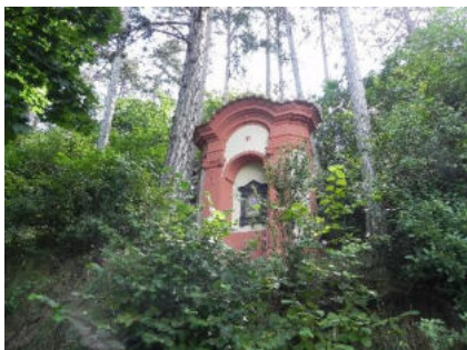
Zastavení křížové cesty v Liběchově

Kousek od Prahy, za Mělníkem, se u Labe nachází Liběchov, dobře dostupný pražskou integrovanou dopravou. Zajímavé je, že až sem zasahovaly Sudety. Na vršku, jehož stráně pokrývá vinice, se nachází kostel Sv. Ducha a Božího hrobu. Je na něj smutný pohled, jelikož jeho stav je neutěšený. Je to velká škoda, místo je zajímavé a je odtud krásný výhled na České středohoří.