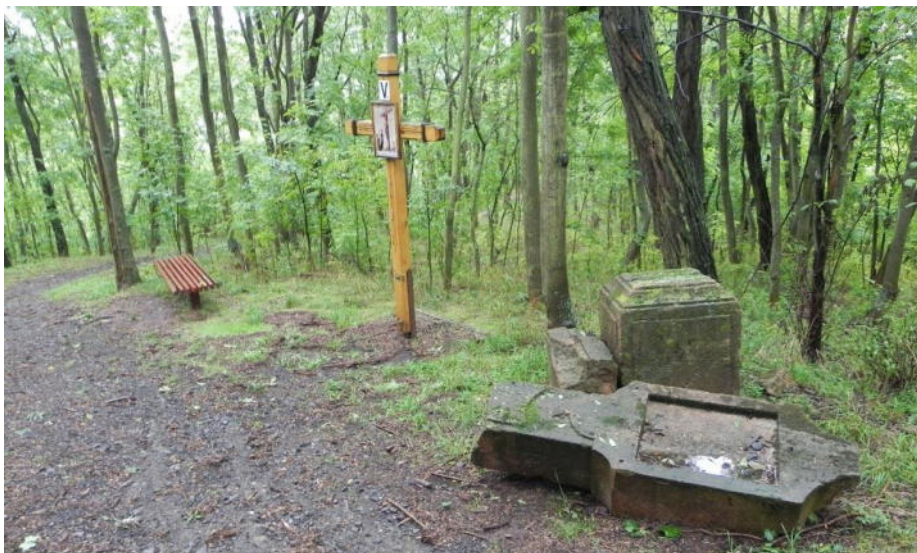
Jedno ze zastavení křížové cesty v Kryrech

původní zastavení křížové cesty Sedmi bolestí Panny Marie. Ostatních šest z pískovcových kvádrů bylo mezi lety 1945–1989 rozvaleno. Až v posledních letech byly znovu obnoveny, ale ne v původní podobě. Vedle