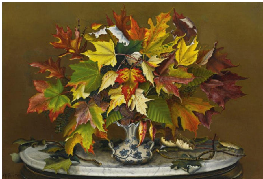
Podzimní listí od Sarah Jane Prentissové, olej na plátně