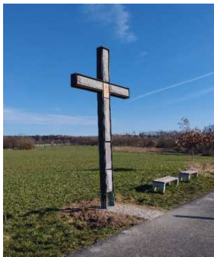
Kříž u cyklostezky z Kolovrat do Mnichovic.

Od konce zimy je hotový čtyřmetrový kříž u cyklostezky z Kolovrat do Mnichovic, u polí nad Marvánkem. O jeho vznik se zasloužila naše farnost ve spolupráci s městem Říčany. Do kovového rámu byla vložena výplň z lokální žuly, pod mozaikou