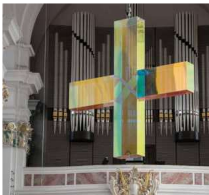
Putovní skleněný kříž v Heidelbergu.