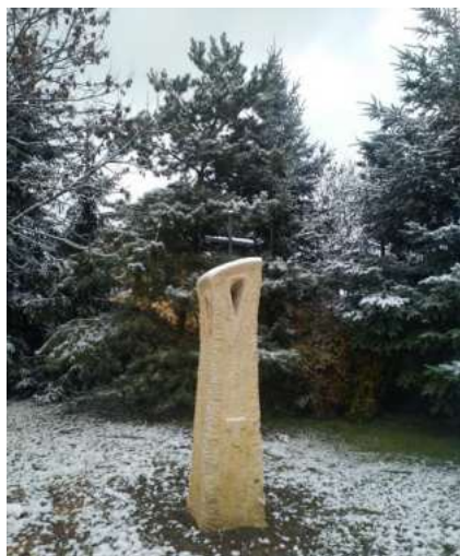
Kříž v Pacově.

Jeho vznik vysvětluje dobu, kdy se svět jako by obrátil naruby: přišel covid-19, vysoké počty zemřelých, válka na Ukrajině, energetická krize... Žijeme v jakémsi zmatku. Naši předkové, po nichž nám zbyly kříže, kapličky, zvoničky a jiné památky, na tom nebyli jinak. Křížek má podle své iniciátorky připomenout kolemjdoucím radost ze života a možnost naplnit každý den dobrými skutky.