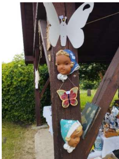
Nabídka dobrobazarového zboží je pokaždé pestrá