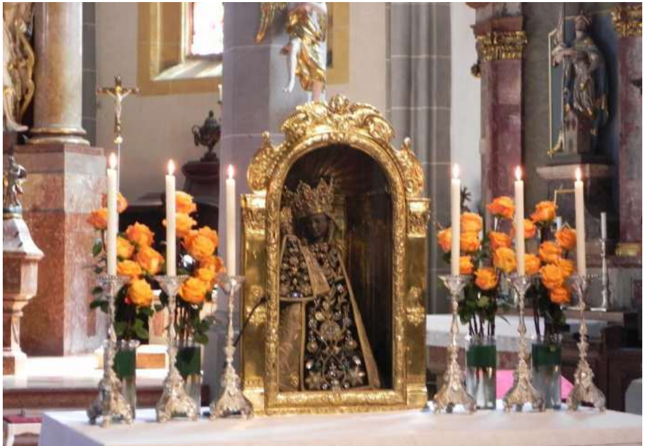
Černá madona v srdci Bavorska

Tak jsem Naši milou paní z Altöttingu mohl spatřit. Pochází ze 14. století z Burgundska a je 64 centimetrů vysoká. Patří mezi černé madony. Tady zčernalo lipové dřevo, které bylo po staletí vystaveno kouři a sazím ze svíček.