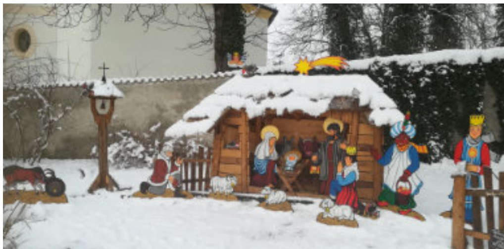
Betlém ve Velkých Popovicích. Autorkou malovaných figur je Naděžda Kotrčová, dřevěné části vyrobil Kamil Čelikovský