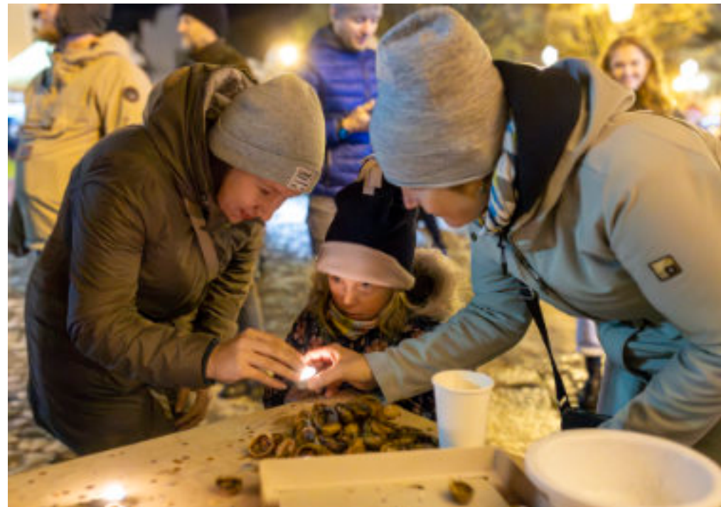
Pouštění lodiček z ořechových skořápek o druhé adventní neděli v Říčanech

Na začátku štědrovečerní večeře jsme se modlili a vzpomínali na ty, kteří již s námi nejsou. Po návratu z půlnoční jsme s maminkou a sestrou třásly bezem se slovy Třesu, třesu bez, pověz ty mi pes, kde můj milý na večeři dnes . Potom jsme vzaly různé pochoutky a venku jsme říkaly Zahrádko vstávej, dobrou úrodu