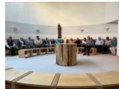
Večerní chvály na mezinárodním setkání